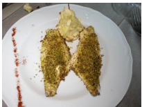
Orata in panatura di pistacchio con patate duchessa alla mandorla