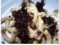
Maccheroncini alle castagne con pescatrice ed alga di mare