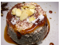
Parfait alle mandorle

Cuocere un filetto di orata può sembrare facile ma vi invito a provare a casa, il risultato non è sempre garantito. Le sue carni sono morbide, relativamente grasse, in misura maggiore quando di allevamento, ma nonostante ciò è facile farla seccare in forno o in padella, rendendola stopposa e poco piacevole. Nel piatto di Sergio i filetti erano succosi e quindi morbidissimi, prova ne è la facilità con cui ho tolto la pelle, ma anche la panatura di pistacchio, rimasta viva e gustosa e non bruciacciata come purtroppo spesso capita. Unico neo, la presenza di spine che rendevano traditore il boccone! Il contorno, invece, era la dimostrazione di come si possa riciclare un classico come la patata duchessa sbanalizzandolo per bene. Essa era composta dal solito purè, ma modellato a forma di pera e cosperso da scaglie tostate di mandorla, presumo però che in questo caso il passaggio in forno sia stato molto veloce.