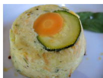
Tortino di ricotta e verdure

La Caponatina era stata realizzata friggendo dei tocchetti di zuccina napoletana secca, nota anche come "zuccina da friggere", nel palermitano essa viene utilizzato quasi esclusivamente per condire la pasta dopo essere stata tagliata a rondelle e frita in olio extra vergine d'oliva. Per l'occasione ho scoperto che sulle Madonie , invece, soprattutto a Castelbuono e dintorni, si usa seccarla, probabilmente per poterla conservare ed impiegare anche fuori stagione. Comunque, l'idea di utilizzarla al posto della melanzana mi è piaciuta molto, anche per il grande equilibrio dell'agrodolce.