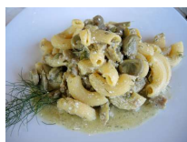
Pasta con carciofi, fave, finocchietto, salsiccia e ricotta

Il Tortino era una vera nuvola di piacere, mentre si scioglieva in bocca era possibile distinguere i singoli sapori degli ingredienti, soprattutto quello della ricotta che in questa tipologia di utilizzo, spesso viene sovrastato o letteralmente "bruciato" dalla cottura, in questo caso invece si fondeva perfettamente con le verdure. Anche l'aspetto era invitante, il tortino aveva l'esterno di un colore chiaro e compatto, costituendo il punto forte di una presentazione sobria ma efficace.