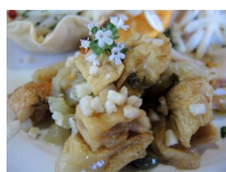
Caponatina di zuccina secca

Già solo con questi piatti c'era da saziarsi! Ma tra di essi due mi hanno particolarmente impressionato per la loro eccellenza: la Caponatina di zuccina secca ed il Tortino di ricotta con verdure .