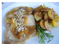
Cosciotto di maiale con mele e mandorle

Scritto da Maurizio Artusi Giovedì 14 Maggio 2015 00:20