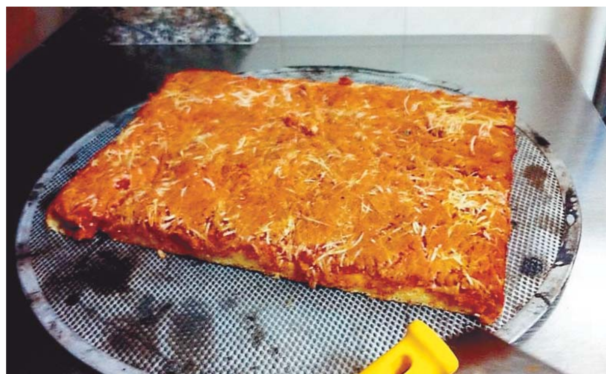
Sopra un esempio di pizza fatta in casa, seguendo la «Ricetta della pizza in teglia»

re nella parte più fredda del frigo (alla temperatura di 3-4 gradi) utilizzando un contenitore coperto, al fine di evitare il seccarsi della pasta esterna. Lasciare maturare l'impasto per almeno 24 ore. Portarlo, poi, alla temperatura ambiente di circa 20 gradi e farlo lievitare per 4 ore. Sistemare l'impasto in una teglia. Continuare la lievitazione per altre 2-4 ore e condire con il solo pomodoro. Infornare per circa 15-20 minuti in forno caldo a 250 gradi (massima temperatura di un forno casalingo). A cottura quasi ultimata, sfornare e aggiungere gli altri condimenti. Infornare nuovamente al massimo per ulteriori 10 minuti. Condire a piacimento con olio extravergine d'oliva e origano. R. Vec.